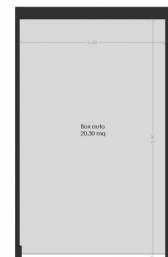
Pianta piano terra - scala 1:100