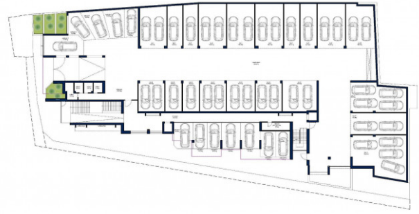
PIANO SOTTERRANEO SCALA 1:200